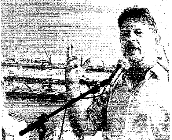
Cid Gomes não quer mais ser candidato

Os eventos se encerram no mês que vem, com os encontros em Pacajus, na Região Metropolitana de Fortaleza, em 11 de março, e em Pararucu, no Litoral Oeste, em 12 de março. A partir de abril a discussão sobre quem será o candidato ou candidata irá afunilar.