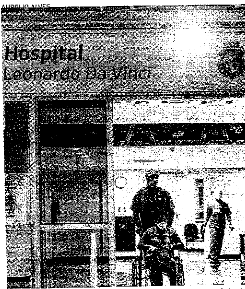
PACIENTE DE ALTA: redução da média de óbitos é puxada por Fortaleza

| COVID-19 | Curvas se diferenciam nas diferentes macrorregiões do Estado. Sertão Central ainda apresenta crescimento. A redução é puxada por Fortaleza