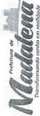
Trecho 1: Estacas 00 a 542